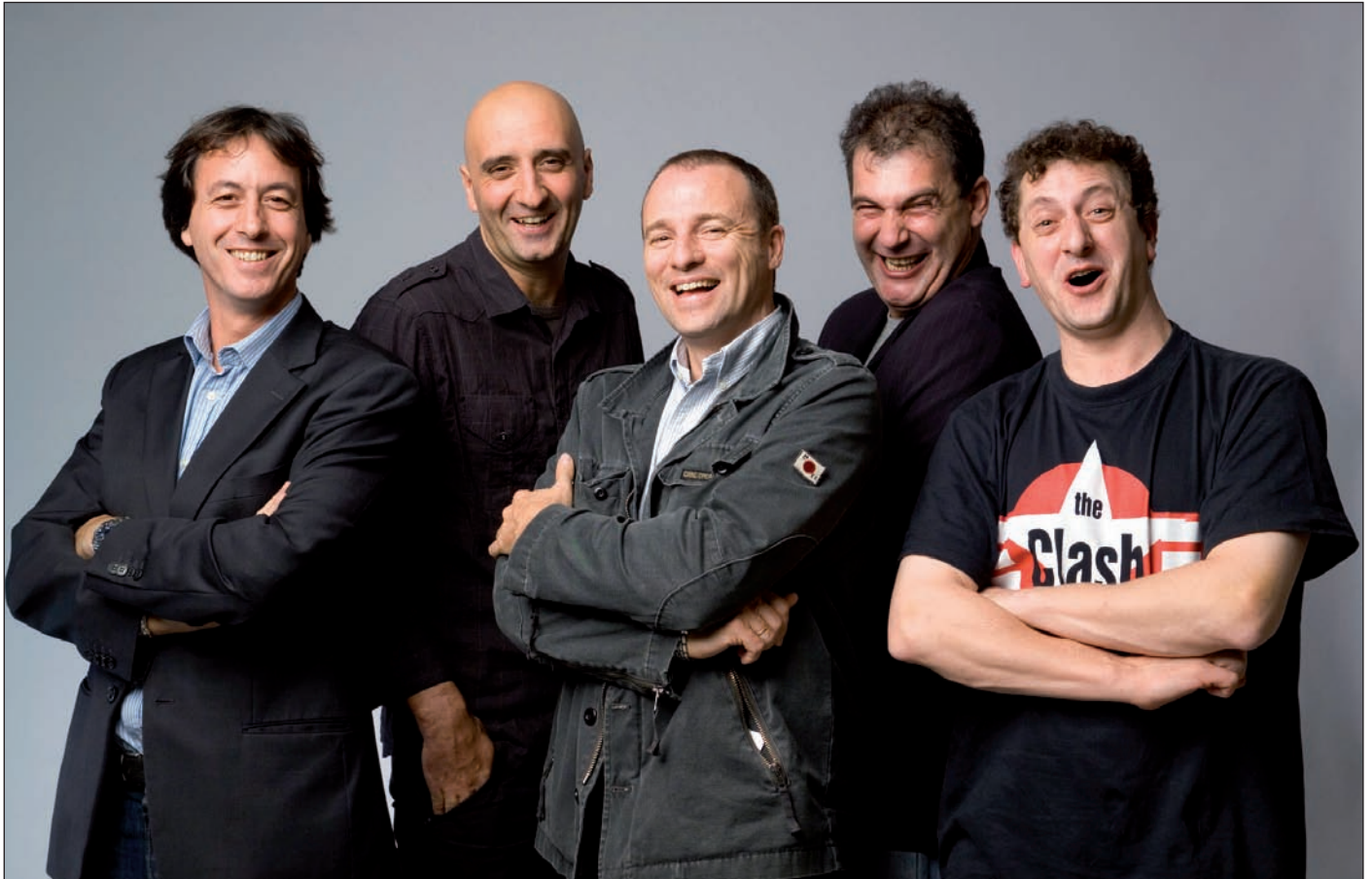
Los fundadores de la Compañía Yllana.

La nueva etapa de la Escuela, que se inaugura el próximo 2 de octubre, incluye novedades como clases de teatro en inglés o iniciación a la impro