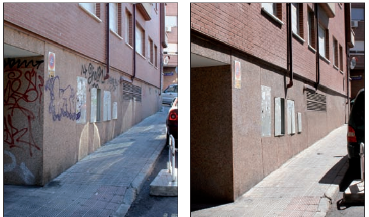
Imágenes del antes y después de la limpieza de la calle Jabonería.