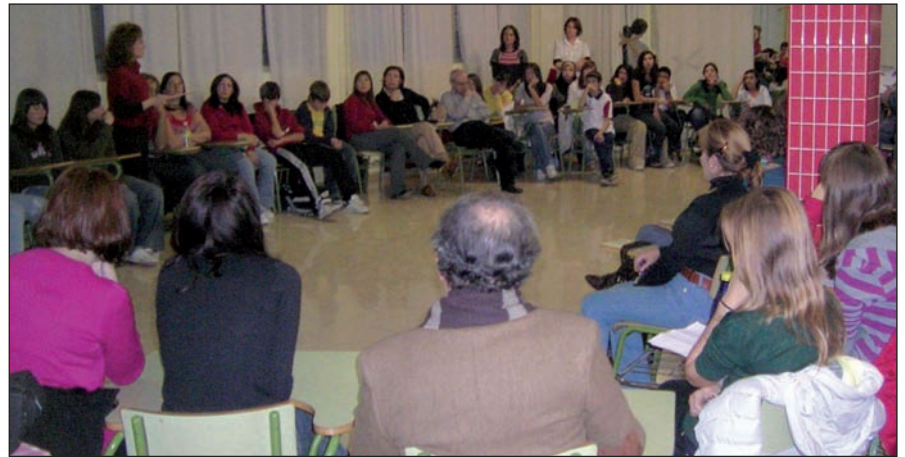
Dinámicas grupales del Programa "Aprendiendo a Convivir".

El área de Familia y Menor ofrece un completo Programa de Formación dirigido a las familias, que se desarrollará a lo largo del curso escolar, con el objetivo de proporcionar un espacio de encuentro y reflexión que ayude a prevenir y resolver situaciones que surjan en el ámbito familiar, así como potenciar una adecuada convivencia familiar. La Concejalía apuesta por la formación como instrumento para conseguir que los padres asuman la responsabilidad de la educación de sus hijos a través del incremento de la información, del conocimiento y de las habilidades que les permitan atender las necesidades de los niños a lo largo de su desarrollo.