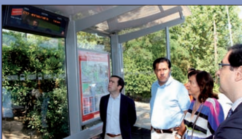
Los paneles ofrecen a los usuarios datos en tiempo real.

Estos paneles, que reciben la información de los autobuses mediante un sistema GPS, son de gran utilidad para el usuario, que tendrá información en tiempo real de la llegada de las líneas que se detienen en esa parada y posibles incidencias durante los itinerarios. Toda la información plasmada en las nueve pantallas llega a su vez al Centro de Control de Auto Periferia, desde donde se coordina y supervisa el normal funcionamiento del servicio.