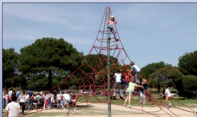
Las Rozas cuenta con 2.364 familias numerosas registradas.

Ser poseedor del título de familia numerosa tiene numerosos beneficios en materia de transporte, con deducciones y bonifica-