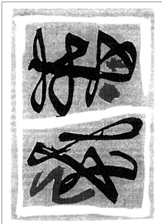
En la imagen, grabado de José Caballero.

El Certamen Nacional de Grabado José Caballero lleva celebrándose desde el año 2000, y se ha consolidado como uno de los más prestigiosos a nivel nacional. Con motivo de este certamen se organiza una muestra de los ganadores y seleccionados en la Sala de Exposiciones Maruja Mallo, Centro Cultural Pérez de la Riva. En la última edición participaron más de 80 artistas procedentes de distintos puntos de España.