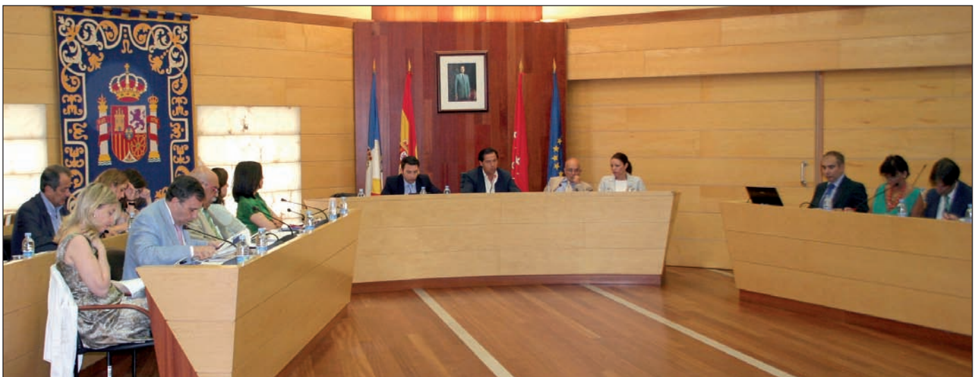
Un momento del Pleno Ordinario correspondiente al mes de julio.

Otra de las modificaciones aprobadas es que las parejas de hecho que causen baja en el padrón automáticamente serán dadas de baja en el Registro. Todos estos cambios se realizan con el propósito de controlar el buen uso de este instrumento y para evitar uniones de conveniencia. Desde 2001, año de creación de este Registro en Las Rozas, se han inscrito 726 parejas de hecho.