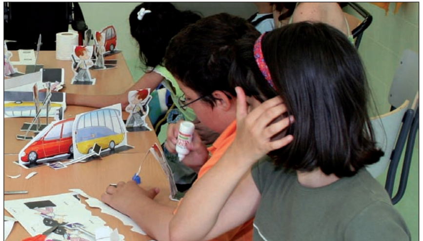
El programa se realiza durante el curso escolar.

Tendrán prioridad en el acceso a las plazas, por este orden, antiguos participantes en el Programa, empadronados en Las Rozas y alumnos/as escolarizados en el Colegio Monte Abantos. El precio para todo el curso es de 180 euros e incluye las actividades extraescolares así como salidas de ocio un sábado al mes, todo ello atendido por personal especializado. El plazo de solicitud de plaza finaliza el próximo 28 de septiembre.