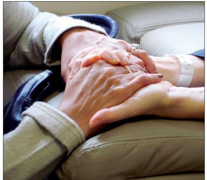
El Banco del Tiempo apela a la solidaridad de la ciudadanía.

El objetivo de crear esta cadena de favores es apelar a la solidaridad de la ciudadanía para reforzar las relaciones interpersonales, la cohesión social y la ayuda mutua. Para que este proyecto funcione es necesaria la participación de los vecinos del municipio, cuantos más mejor, para que este Banco del Tiempo cuente con muchos "fondos" y eso redunde en un "enriquecimiento" de la comunidad.