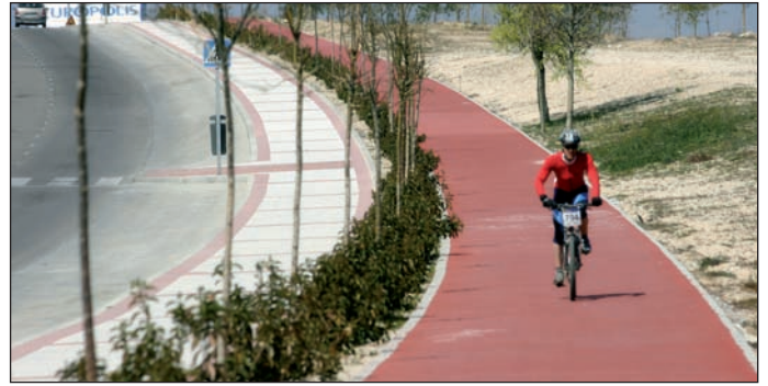
Cada año, la Semana de la Movilidad aborda un tema relacionado con la movilidad sostenible.