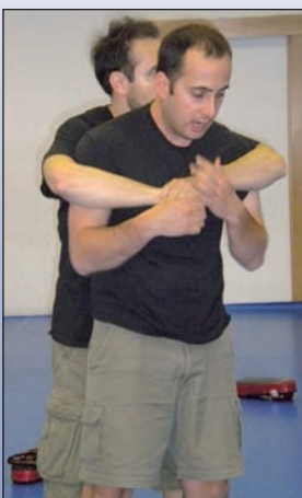
Los cursos incluyeron técnicas de defensa personal.