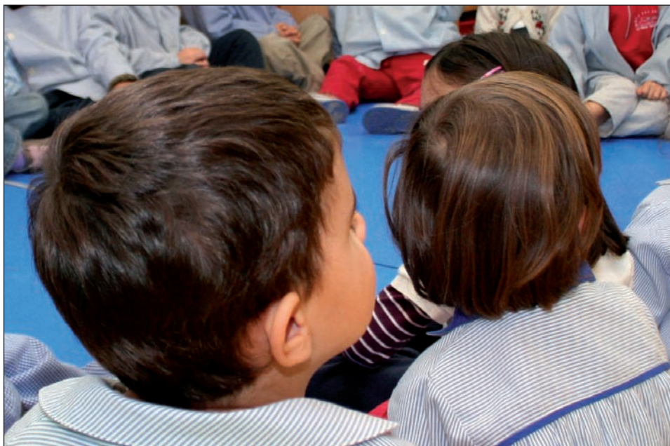
Se ha incrementado el número de alumnos en escuelas infantiles.