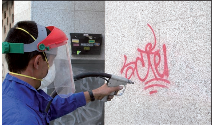
Eliminación de un grafiti mediante un equipo de hidroborrado a presión

La Concejalía de Servicios a la Ciudad elaborará un protocolo de actuación para todo el territorio municipal, que incluirá mayor control policial, y trabajará en la concienciación de la ciudadanía para que se respeten los espacios públicos y, si se desea practicar esta expresión gráfica urbana, se haga en zonas destinadas a ello.