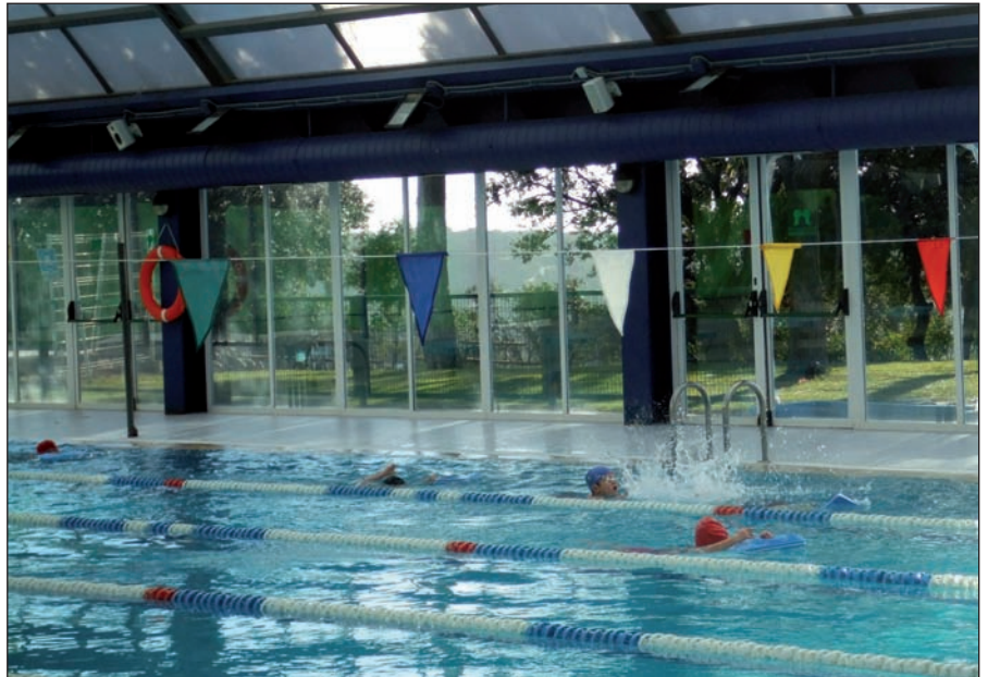
La natación es uno de los deportes más demandados.

Los distintos cursos se desarrollan en las instalaciones polideportivas municipales (Alfredo Espiniella, Dehesa de Navalcarbón, Las Matas, Entremontes y Centro Municipal de Patinaje). El precio medio para los participantes empadronados en Las Rozas oscila entre los