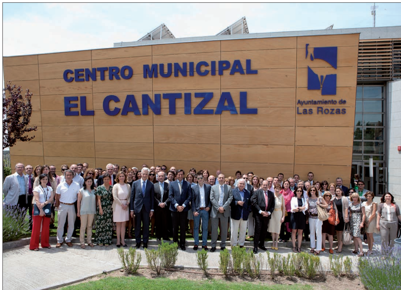
Foto de familia de las autoridades y los representantes de las empresas participantes en la iniciativa.

El Ayuntamiento y la Fundación Junior Achievement colaboran para ofrecer a los estudiantes un contacto directo con la realidad laboral de una treintena de empresas punteras