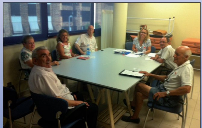
En el proyecto han participado varios grupos de trabajo.

Se ha realizado un completo diagnóstico de la ciudad a través del trabajo de una serie de grupos entre los que destacan, además de las personas mayores, las empresas de servicios enfocadas a cubrir sus necesidades, las diferentes asociaciones vinculadas al trabajo en pro de los mayores y el personal técnico con el que