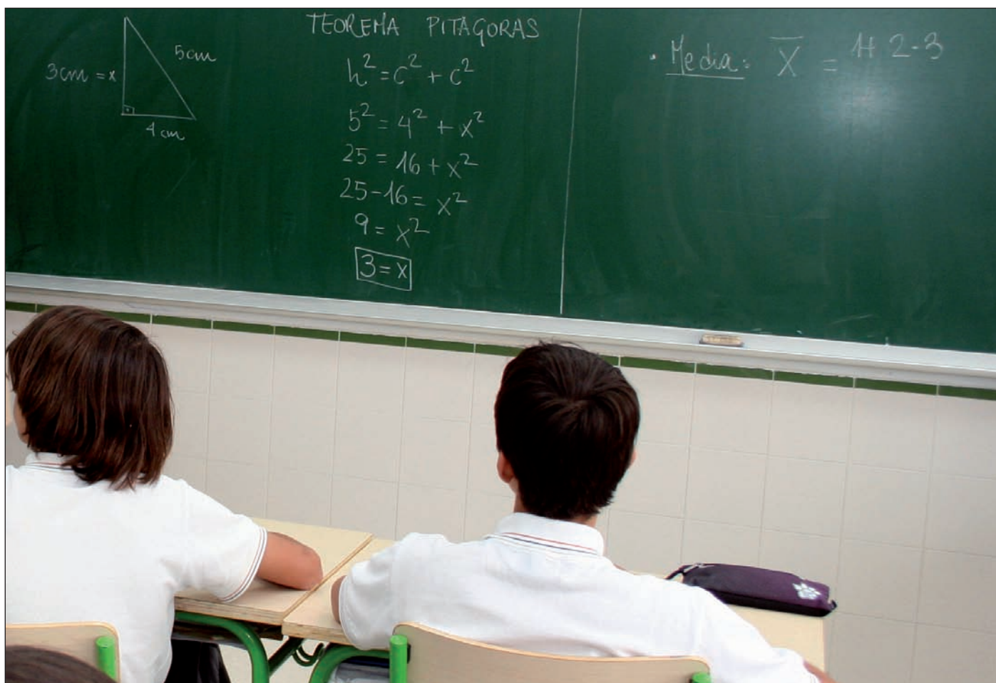
Se ha ampliado el número de aulas en algunos centros.

Del total de solicitudes casi la mitad corresponden a niños de 3 años que comienzan su educación en los cursos de 1º de Infantil, mientras que el resto corresponden a solicitudes de cambio de centro dentro del municipio, o bien traslados de estudiantes procedentes de otros municipios.