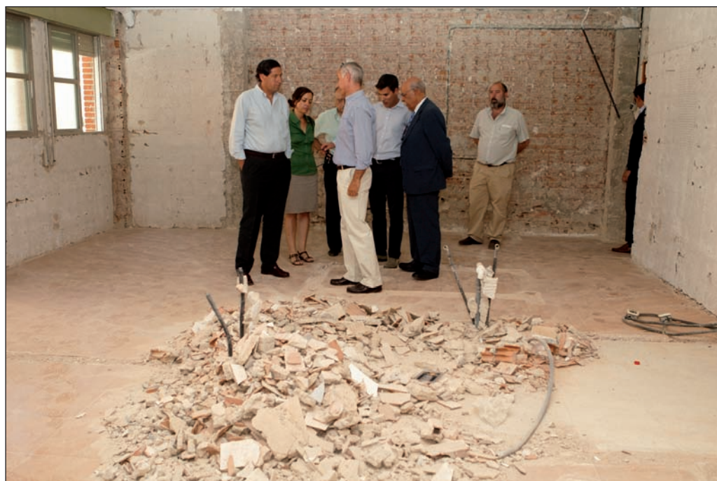
Durante el verano se han realizado diversas obras en los centros escolares públicos.

vergadura han sido los trabajos en el colegio Fernando de los Ríos, donde se han reformado y adecuado todos los aseos que dan servicio al patio de Primaria. La inversión realizada por el Ayuntamiento para estas actuaciones ha sido de 230.000 euros.