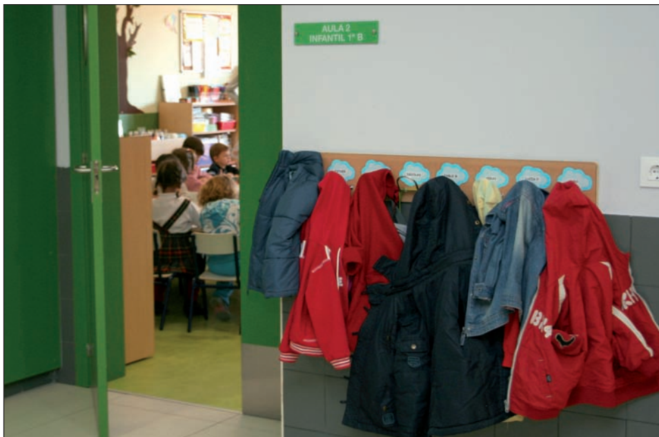
La escolarización en centros públicos ha aumentado un 6% respecto al pasado curso.

Por otra parte, las escuelas infantiles públicas –dos de la Comunidad y dos municipales– abrieron sus puertas el pasado 3 de septiembre para acoger a los casi 540 alumnos matriculados, un 15% más que el curso pasado. A ellas se sumaron los 22 centros privados del municipio que ofrecen educación a casi 1.500 pequeños de 0 a 3 años, un 55% más que el curso pasado. Este incremento refleja el crecimiento de la población infantil y el esfuerzo de los centros privados por ajustar sus precios.