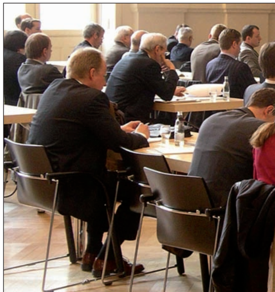
Los malos hábitos posturales, una de las causas de los dolores de espalda.

El programa tuvo una gran acogida y valoraciones muy positivas por parte de los usuarios. Los participantes han sido un 59% mujeres y un 41% hombres, con edades comprendidas entre los 18 y los 70 años, siendo la edad media de 50 años.